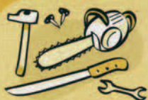
Outils Te mau tauihaa