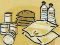
Vivres Te mau ma'a huru rau