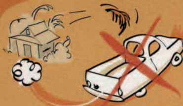
Ne pas s'eloigner de la maison Eiaha e faatea i to outou fare