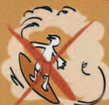
Ne pas sortir en mer Eiaha e haere na'ia i te miti