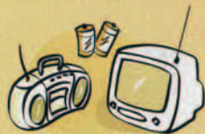
Radio & television Afata radio e te afata teata