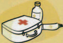
Pharmacie Afata raau