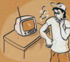
Radio & television I roto i te afata radio e te afata teata