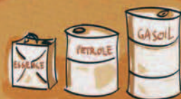
Essence, petrole, gasoil Te mori, te mori arahu, te hinu